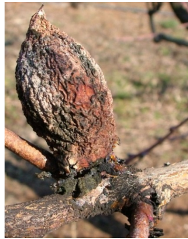
Προσβολή από Μονίλια