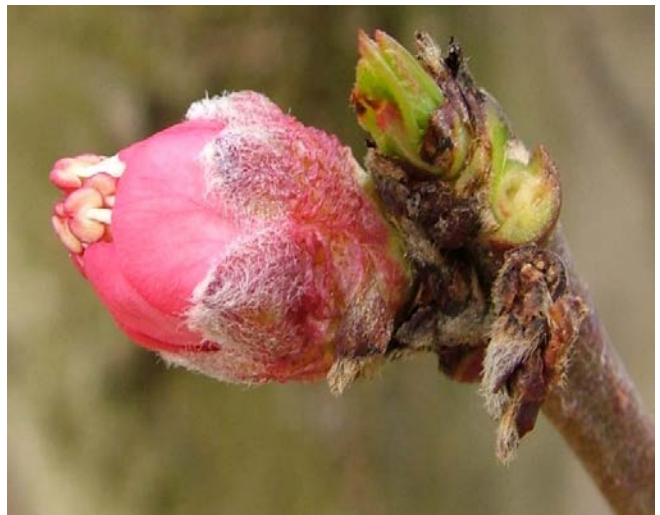
Ε Εμφάνιση στημόνων