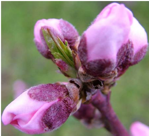
Δ Εμφάνιση στεφάνης