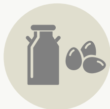
ΓΑΛΑ - ΑΥΓΑ