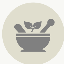
ΦΑΡΜΑΚΕΥΤΙΚΑ ΚΑΙ ΑΡΩΜΑΤΙΚΑ ΦΥΤΑ