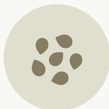
ΣΠΟΡΟΙ & ΠΟΛΛΑΠΛΑΣΙΑΣΤΙΚΟ ΥΛΙΚΟ