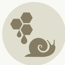
ΜΕΛΙ - ΣΗΡΟΤΡΟΦΙΑ - ΣΑΛΙΓΚΑΡΙΑ